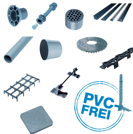
Dieses Sortiment kann sich sehen lassen – PVC-freie Schalungstechnik von Haberkorn.

Schmierstoffe. Mit 100.000 Lagerartikeln, kompetenten Fachberatern und maßgeschneiderten Logistiklösungen vereinfacht Haberkorn den Weg der Produkte dorthin, wo sie gebraucht werden.